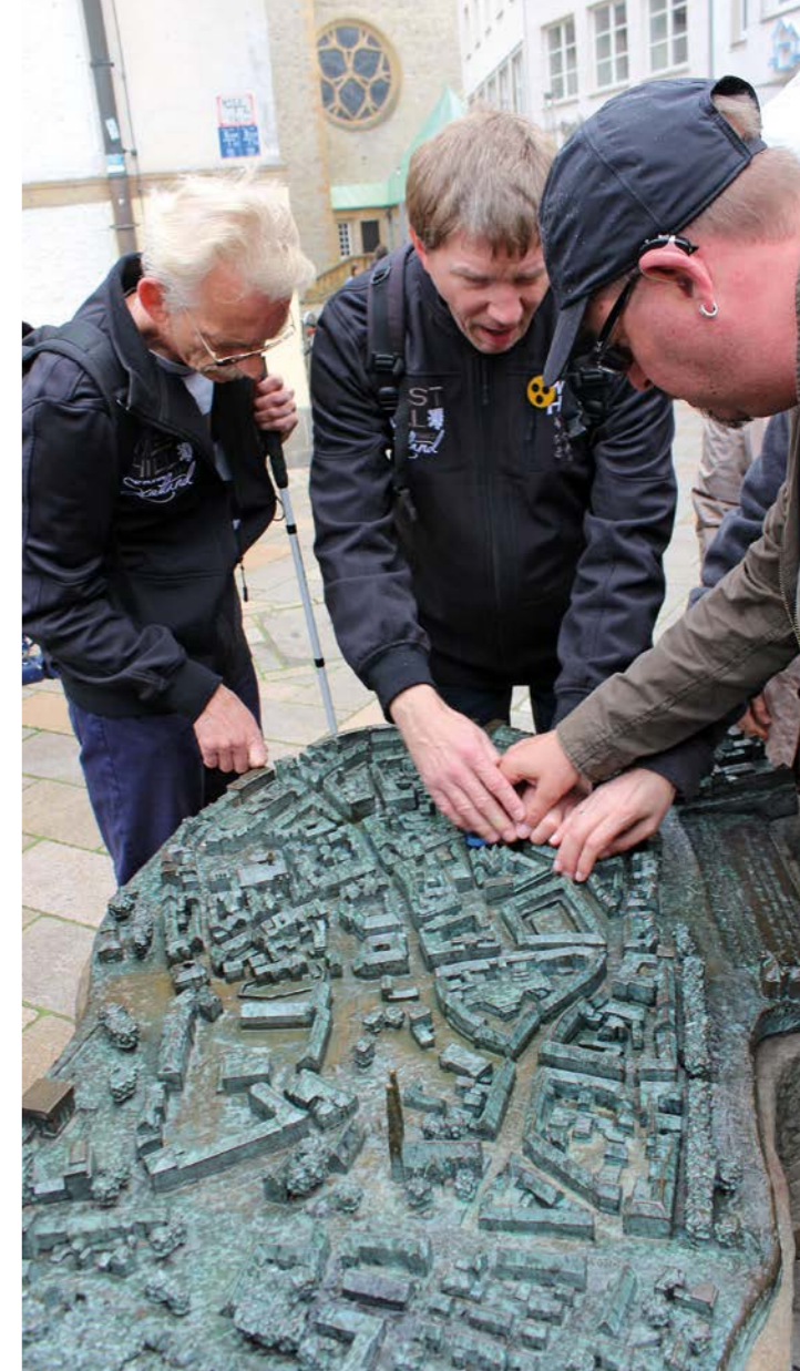
Taubblinde beim Ertasten des Stadtmodell von Bielefeld

Das Projekt erstreckt sich über einen Zeitraum von 3 Jahren von Januar 2015 bis Dezember 2017.